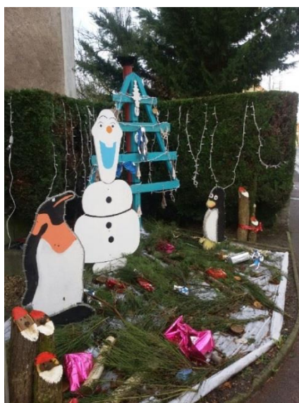
Décorations de Noël 2017